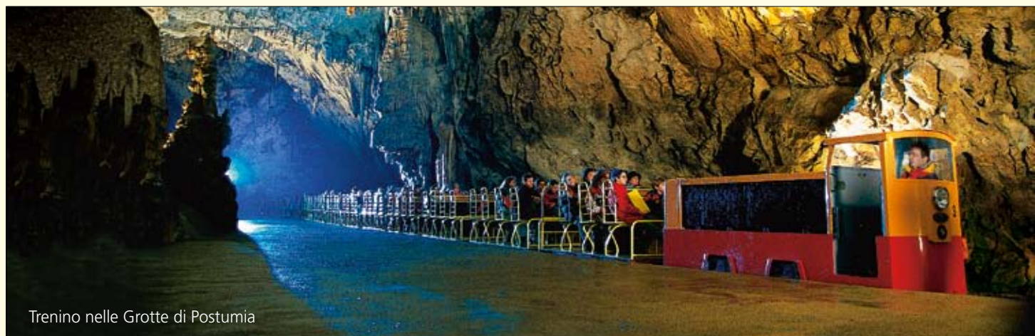
Trenino nelle Grotte di Postumia